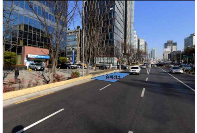
서울 신도림 / 07:20, 10:10 (월~ 목) 신도림 1번출구 건너 홈플러스(우측방향) 뒤편 공원 정차