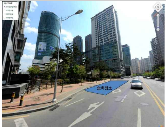
판교 / 07시 45분 판교역 4번 출구 시티은행 앞