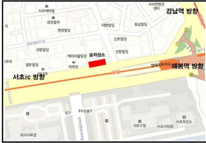
서울 양재역 / 07:30 (양재역 1번출구 수협은행 양재역지점 앞)