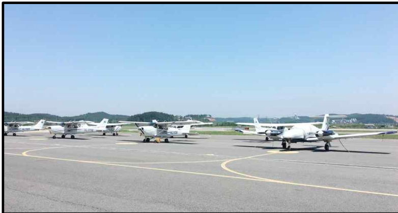
좌측 Cessna-C172S 우측 Seminole-PA44

먼저 한서대학교 태안캠퍼스에 비행장을 방문하여 활주로와 격납고를 방문했습니다. 한서대학교 교수님의 설명과 Q&A시간을 가졌습니다.