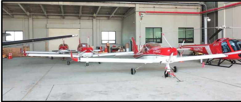
중앙 AT-4와 우측 ENSTROM 280