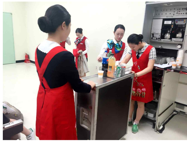
위의 사진은 식음료실습 체험을 하고 있는 사진입니다.